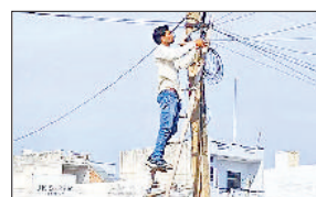
पूडरी। हुड़ा सेक्टर में खुद स्ट्रीट लाइट ठीक करते स्थानीय निवासी।

पूडरी की एकमात्र हुड़ा कालोनी में जन सुविधाओं के नाम पर समस्याएं ही समस्याएं मिल रही हैं। स्थिति ये है कि इन समस्याओं को न तो हुड़ा विभाग और न ही नपा ठीक करवाने के अधिकारी एक-दूसरे विभाग की जिम्मेदारी बताकर पल्ला झाड़ लेते हैं। हुड़ा निवासी नहीं समझ पा रहे कि आखिर वे अपनी समस्या लेकर किसके पास जाएं। हुड़ा कालोनी में नाले टूट पड़े हैं। सीवरज व्यवस्था