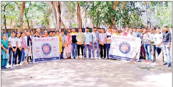
जीट। शिविर में भाग लेते स्वयंसेवक।

अन्य लोग एवं अधिकतागण हिस्सा लेंगे। इस सेमिनार में हरियाणा प्रदेश के लिए अलग से नई राजधानी और अलग उच्च न्यायालय के मुद्दे को जोर-शोर से उठाया जाएगा। इसके लिए लोगों को जागरूक किया जाएगा ताकि वे नई राजधानी और अलग उच्च न्यायालय के महत्व को समझ सकें।