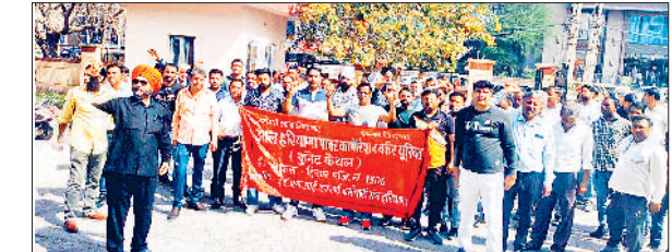
कैथल। नारेबाजी करते बिजली कर्मचारी।

अपने सामने खुद की लाइटें लगवा रहे हैं। लाइटों को लेकर जब नगरपालिका प्रशासन से मिले तो नगरपालिका ने यह कहकर मना कर दिया कि पूडरी हुड़ा में नई लाइट लगाने का हमारे का अधिकार नहीं है, हुड़ा के अधीन चला गया है। जब हुड़ा प्रशासन से बात की जाती है तो कह दिया जाता है हमारे पास तो केवल प्रॉपर्टी और नरेशें आए हैं। शेष अधिकार अभी नपा के पास है। हुड़ा निवासी अब समस्याओं को लेकर हुड़ा विभाग के खिलाफ कोर्ट में जाने की तैयारी कर रहे हैं।