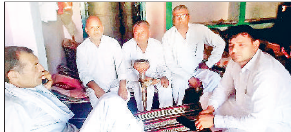
जुलाना। लजवाना गांव में लोगों को कार्यक्रम को लेकर निमंत्रण देते गणमान्य लोग।