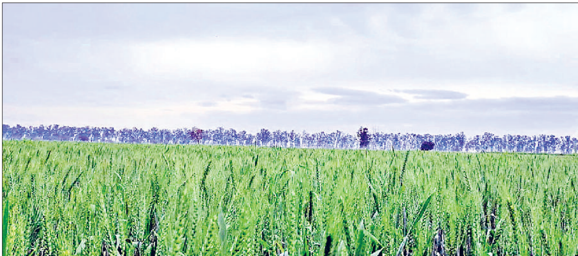
जीद। सुबह के समय आरमान में छाई काली घटाएं।

मौसम में ही रहा बदलाव किसानों के लिए परेशानी का सबब बना हुआ है। बुधवार को मौसम ने करवट ली और सुबह के समय हलकी बूँदाबांदी हुई। हालांकि यह ज्यादा देर तक नहीं हुई लेकिन बूँदाबांदी के दौरान छाप काले बादलों ने किसानों की सांसों को कुछ समय के लिए रोकने का काम किया। कुछ समय तेज हवा चलने के बाद मौसम फिर बदला और सूर्य देवता ने आसमान से दर्शन दिए। दोपहर होते-होते तेज धूप निकल आई। ऐसे में मौसम के बदले तैवरों ने किसानों को चिंता में डाल दिया। इस समय किसानों को यही भय सता रहा है कि मौसम के बिगड़े तैवर उनकी फसलों को तबाह न कर दें। बुधवार को अधिकतम तापमान 34 डिग्री तथा न्यूनतम तापमान 22 डिग्री दर्ज किया गया। हवा की गति आठ किलोमीटर प्रति