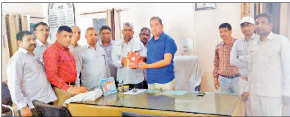
जीट। जिला मौलिक शिक्षा अधिकारी से मांगों को लेकर मिलते अध्यापक।