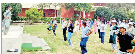
जीट। शिविर में योग करते हुए छात्राएं।